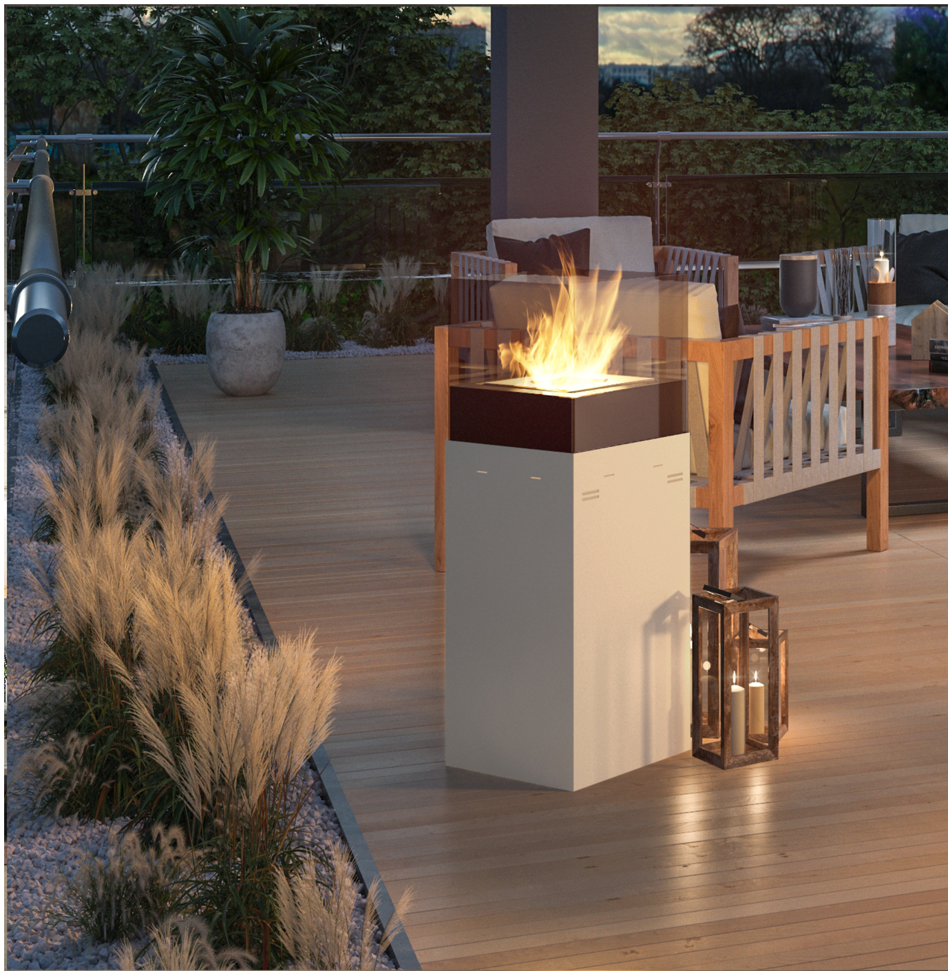
Biokominek Instand 850